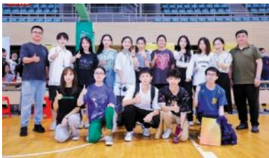
(来源 | 学工部 研工部 全媒体中心)

此外,今年学院研究生报考人数再创新高,共有1900余人报名,最终招收硕士研究生233人,其中,全日制学术学位52人、全日制专业学位172人(含港澳台研究生3人)、非全日制专业学位8人、国际生1人。