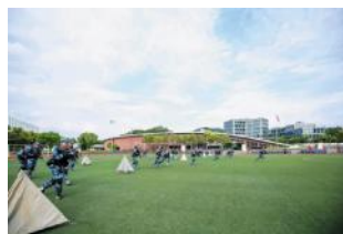
每一个坚毅的眼神终将化为紫色的翅膀,载着不移的信念尽情翱翔。