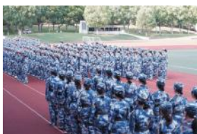
从杂乱无章到整齐划一,俯首青春由你刻画,一招一式,一令一动,利落干净的动作背后是数以万计的练习,是在朝阳和晚霞中流下的汗水。