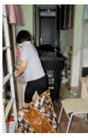
他们尽心负责、耐心细致,让宿舍的每一寸空间,都焕发温馨的光亮。