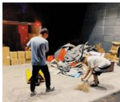
总有人在默默负重前行,无畏夏日无处不在的“烤”验,用汗水诠释坚守,驱散浙音蒸腾的暑意。