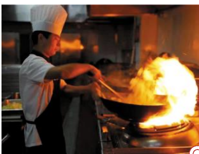
他们与蒸汽为伴,保证留校师生餐饮供应,烹饪出美味与温暖。