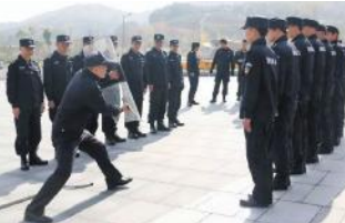
他们在炎炎烈日中,做好各项巡查、防护,守好安全、防疫第一道防线。