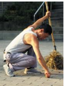
他们头顶烈日,挥汗如雨,将校园每一个角落,装点上新意。

天气炎热,热浪蒸腾。在高温预警下,依然有一群可爱可敬的人,无畏高温,不惧“烤”验,坚守在各自的岗位,守护着假期的校园。